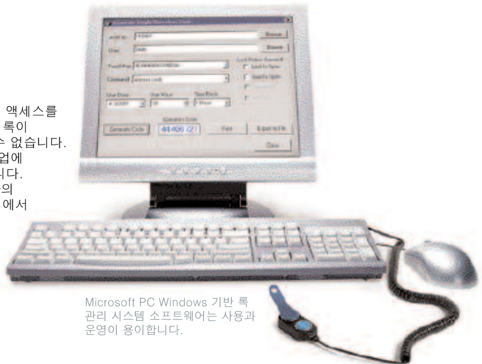
Microsoft PC Windows 기반 록 관리 시스템 소프트웨어는 사용과 운영이 용이합니다.