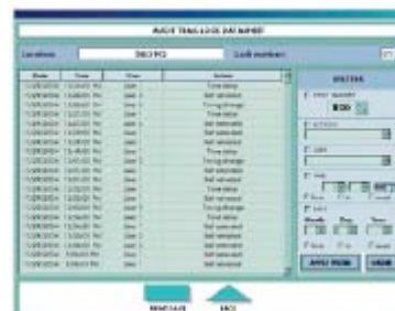
Saque instantáneamente reportes de rastro de auditoría de las cerraduras S&G. No necesita llaves para hacerlo, ni viajar al lugar Obtenga resultados rápidos.