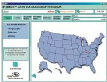
Use la selección estándar de mapas de la Serie IP- o puede importar los suyos para representar visualmente las instalaciones de las cerraduras

El software LMP opcional( Programa de Manejo de la Cerradura) permite a los usuarios de la Serie IP la fácil creación y manejo de plantillas que definan la programación de la cerradura. Aplicadas a un gran grupo de cerraduras y controladas remotamente, estas plantillas eliminan la necesidad de programar cada cerradura individualmente.