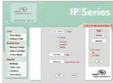
Realice manejo de códigos tal como crear usuarios, borrarlos y cambiarlos – Todo a distancia.