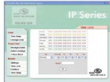
Acceso de control a las cajas de seguridad al configurar fácilmente la hora de la cerradura ya sea desde la interfase del browser o del software LMP