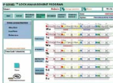
Amigable, flexible y rápido-configure los horarios festivos y la cerradura a distancia