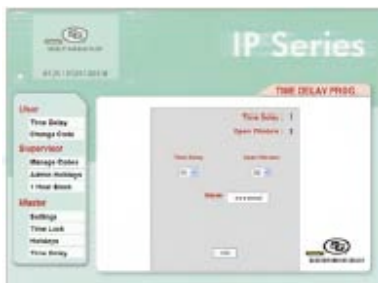
Configure e inicie el tiempo de retardo desde la interfase del browser (navegador)

La tecnología dentro de cada teclado de la Serie IP le permite a usuarios autorizados programar y manejar una cerradura a la vez con la ayuda de un simple navegador ( Browser ) y un PC. No tiene que comprar, mantener o actualizar Software adicional para utilizar la gama completa de operaciones básicas.